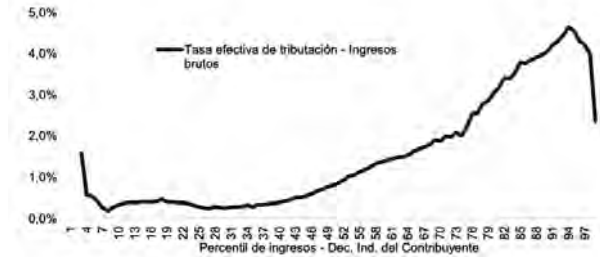
Gráfica 1.Obligación efectiva de tributación sobre las rentas percibidas por personas naturales como un % de las rentas totales, 2018